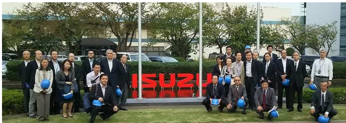
いすゞ藤沢工場見学

当協議会としてもこの研修会を活かし、会員企業の産業振興、人材育成に役立てていきたいと思っております。いすゞ自動車の社員の方々には、お忙しいところ懇切丁寧にご説明、ご案内をいただきましたことに、心から御礼申し上げます。