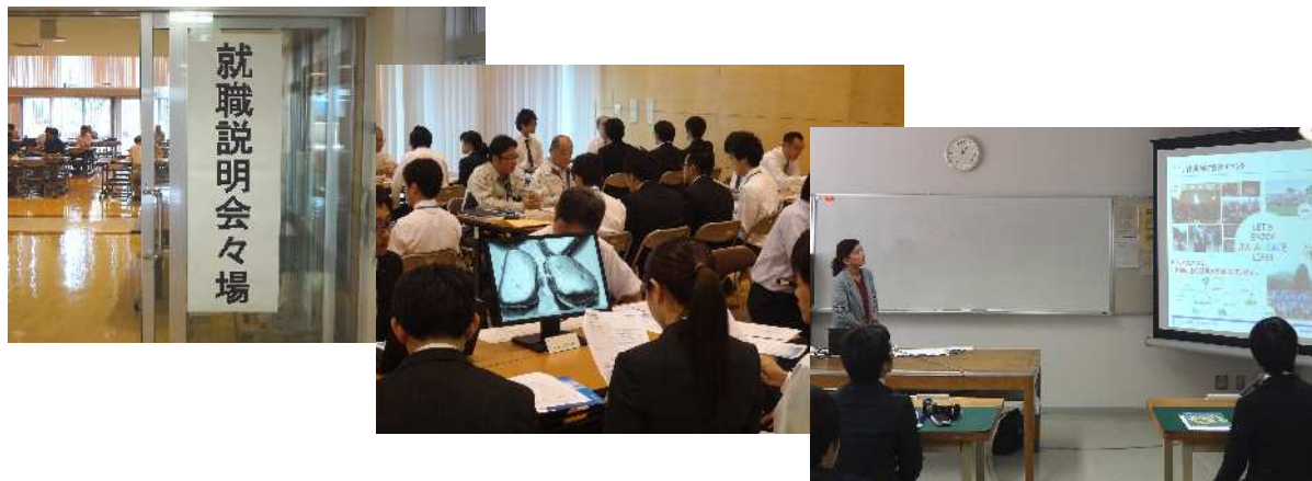
就職説明会の様子