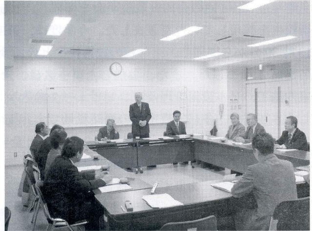
平成21年11月17日開催 第3回理事会

つきましては、当推進協議会の一層の発展の為、貴社におかれましても、関係企業等で未加入の会社がありましたら、入会をお勧めくださるようお願い申し上げます。