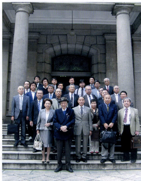
日本銀行本店本館での集合写真

平成21年10月14日（水）15時から、第1回研修会（施設見学会）を実施しました。見学先は、日本銀行本店です。参加人数は、29名でした。右の写真は、日本銀行本店本館の中庭で記念写真を撮ったものです。この本館は、1896（明治29）年に完成した建物で、国の重要文化財に指定されています。見学では、本館、地下金庫、旧営業場、史料展示室などの案内をしていただきました。見学の後、日本銀行の仕事の説明を受け、日本銀行券の発行、流通の仕組み、金融システム、物価の安定を目的とした金融政策などを学びました。