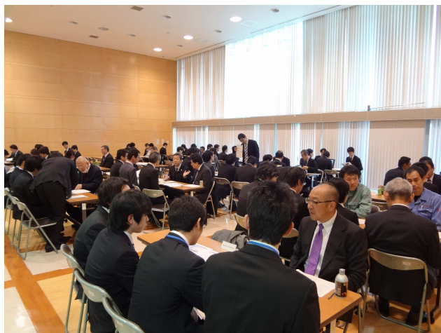
第 4 回就職説明会

きし、また技術校生からも説明を受けたい企業の希望を聞いて、双方のマッチングを取った上での面接を実現しています。今後も、東部総合職業技術校生の就職支援に、多くの会員企業のご協力をお願い申し上げます。