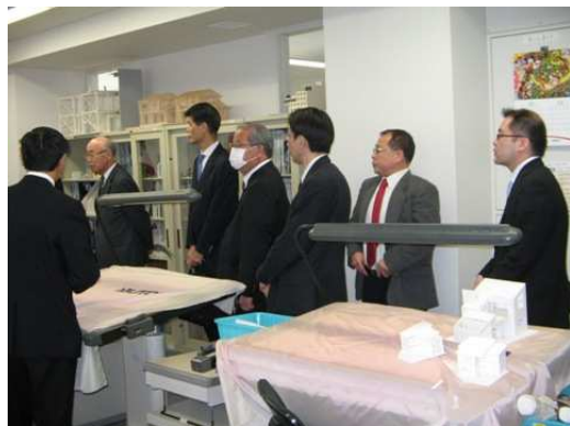
建築設計コースの見学