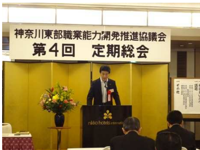
神奈川県産業人材課あいさつ

平成24年5月16日（水）16時から川崎日航ホテルにて、神奈川県職業能力開発推進協議会第4回定期総会が開催されました。