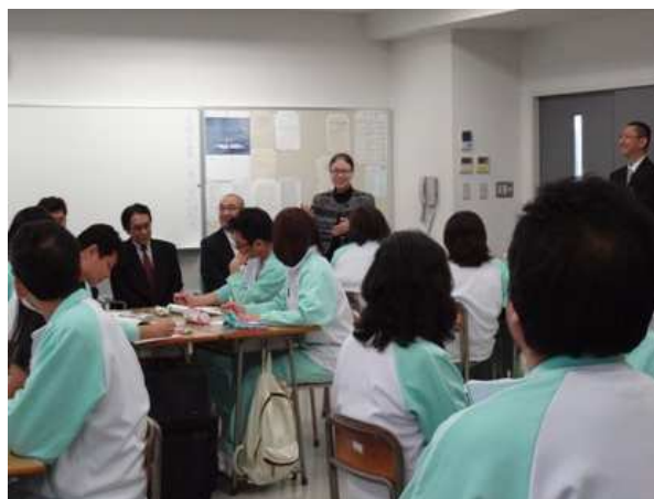
会員とケアワーカーコース技術校生との懇親

22社29名の会員が参加し、訓練内容や就職指導の取り組みについて説明を受け、その後、4グループに分かれて授業見学と意見交換を行いました。