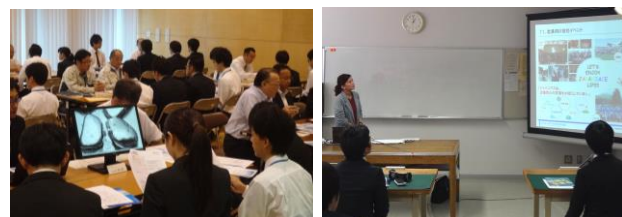
就職説明会の様子