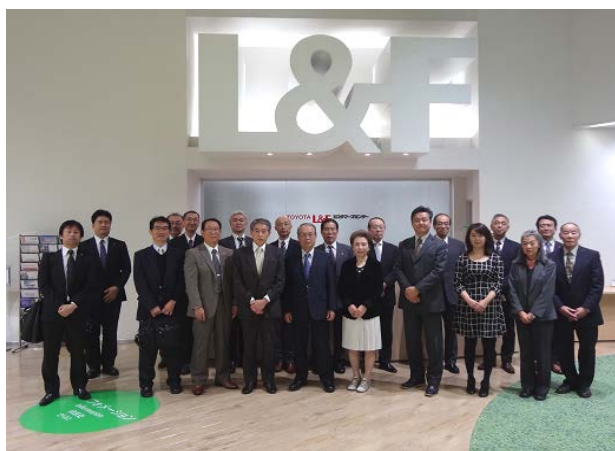
トヨタ L&F カスタマーズセンター東京

第2部として、浦安ブライトンホテル東京ベイにて、情報交換会が開催され、参加会員で研修内容を振り返り、親睦が深まりました。