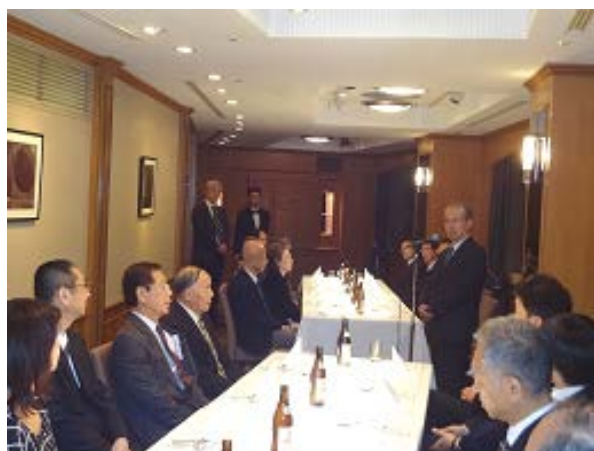
浦安ブライトンホテル東京ベイ