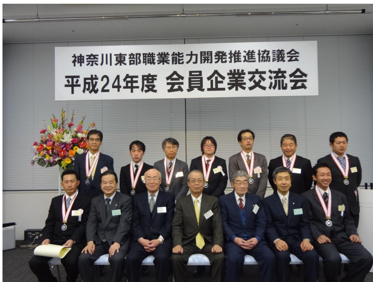
優良従業員表彰受賞者の皆様