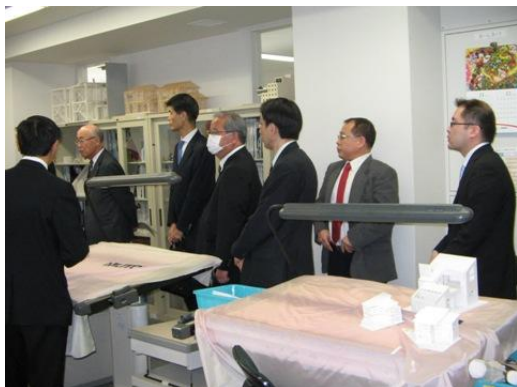
建築設計コースの見学

22社29名の会員が参加し、訓練内容や就職指導の取り組みについて説明を受け、その後、4グループに分かれて授業見学と意見交換を行いました。