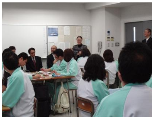
会員とケアワーカーコース技術校生との懇親