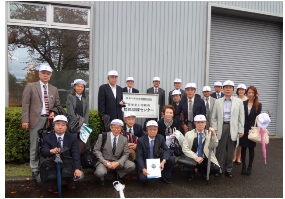
三菱重工業株式会社相模原製作所

平成27年11月2日（月）12時30分から、三菱重工業株式会社相模原製作所および宇宙科学研究所（JAXA）の両施設の見学会を開催しました。生憎の雨模様でしたが、三菱重工業様のご協力により、バスでの移動が叶い、スムーズな見学となりました。当日に3名の欠席となりましたが、16社17名の参加となりました。三菱重工業様、JAXAともに、説明者からの熱のこもった説明を受けて、ものづくりのスピリットを感じることができ、参加者からもご好評をいただきました。来年度も会員の希望を考慮し、有意義なものとなるよう計画していきたいと思っております。