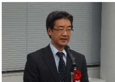
柏崎産業人材課副課長