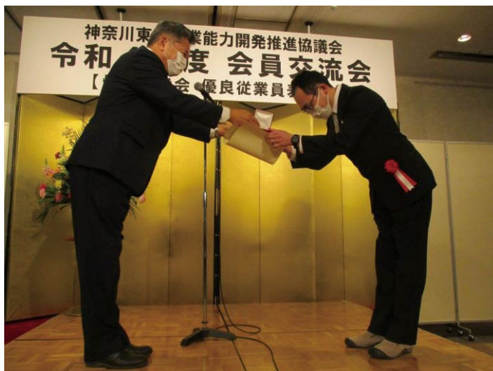
川瀬会長から表彰状の授与

優良従業員表彰は、協議会の会員企業に勤務する優れた従業員を顕彰し、本人の努力をたたえ、会員企業の一層の発展に資することを目的としており、今年度は、11名の方々が表彰されました。受賞者の皆さんからは、所属企業の紹介や受賞の喜びの言葉をいただきました。