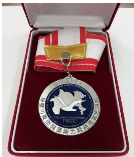
副賞の記念メダル