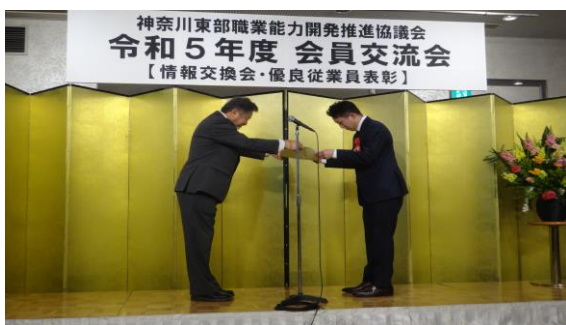
川瀬会長から表彰状

優良従業員表彰は、協議会の会員企業に勤務する優れた従業員を顕彰し、本人の努力をたたえ、会員企業の一層の発展に資することを目的としており、今年度は、10名の方々が表彰されました。