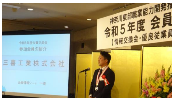
参加会員による自社紹介

優良従業員表彰の後の会員交流会では、参加会員の紹介を含め、会員相互の親睦と連携をより深める機会となりました。