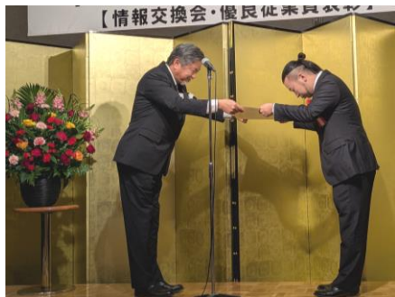
川瀬会長から表彰状の授与

優良従業員表彰は、協議会の会員企業に勤務する優れた従業員を顕彰し、本人の努力をたたえ、会員企業の一層の発展に資することを目的としており、今年度は、13名の方々が表彰されました。