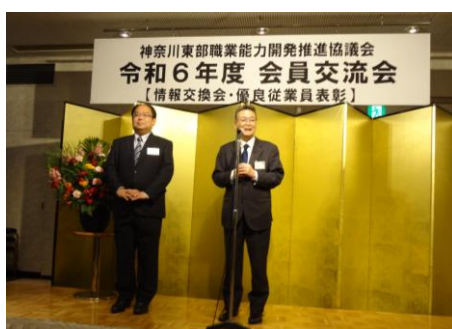
新規会員による自社紹介

優良従業員表彰の後の会員交流会では、新規会員の紹介を含め、会員相互の親睦と連携をより深める機会となりました。